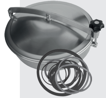
DOMDECKEL TYP Z